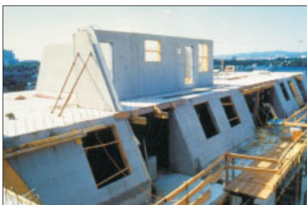
Wohnanlage mit Doppelwandelementen