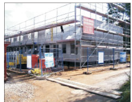
Reihenhaus mit Syspro-Fertigteilen im Rohbau