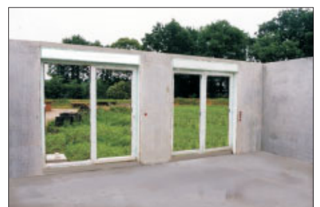
Massivwand mit integrierten Fenstern