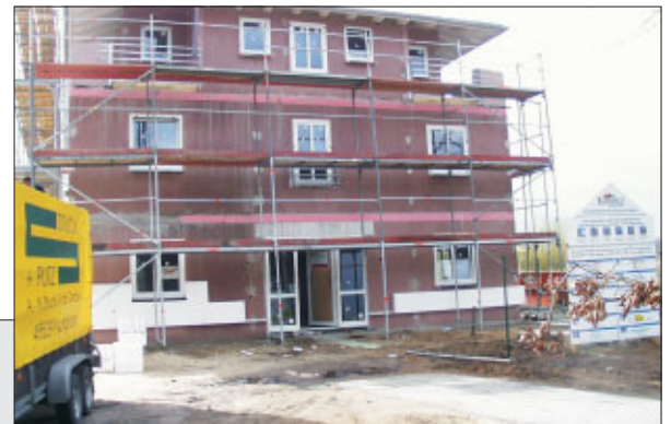
Wohnhaus erstellt mit Sysproton-Bauteilen

Qualität in Beton hat einen Namen: Syspro HiQ.