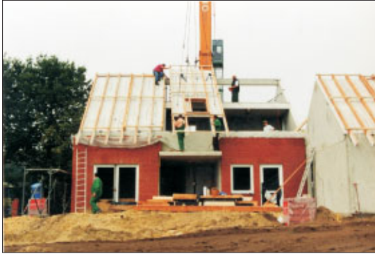
Massivdachelemente des Syspro-Systems bei der Montage