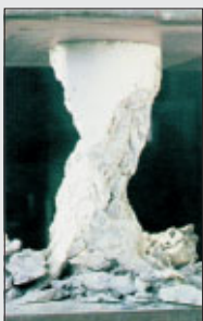
Druckverhalten ohne Fasern