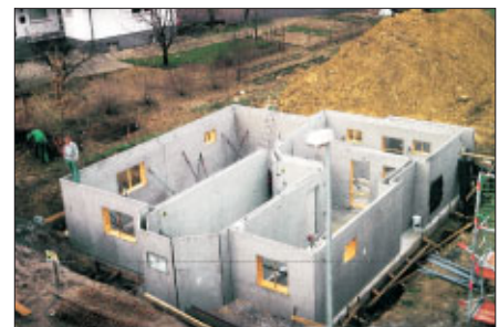
Keller eines Einfamilienhauses mit Doppelwandelementen