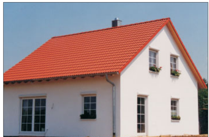
Einfamilienhaus erstellt mit Syspro - Komplettsystem. Haustyp "Bad Urach"