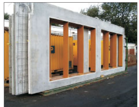
Thermowände im Transportgestell