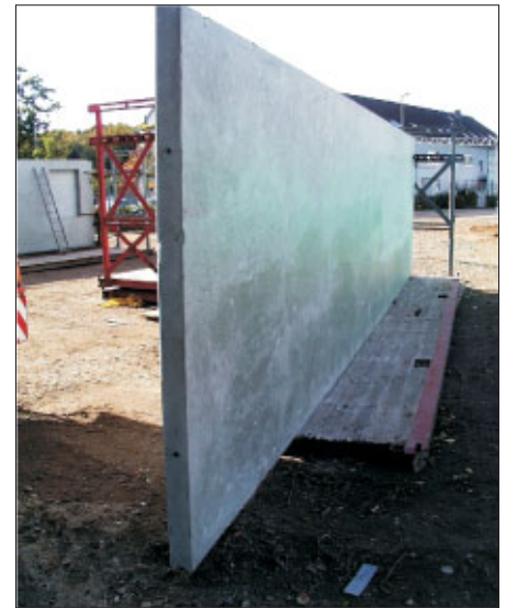
Haustrennwände 0,10 x 12,0 m