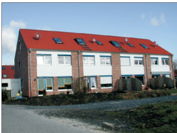
Reihenhausanlage erstellt mit Syspro Massivbausystem