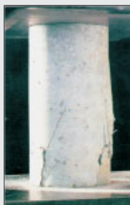
Druckverhalten mit Fasern

Für Sie bedeutet das maximale Sicherheit. Außerdem sparen Sie sich Kosten, Zeit und so manchen Ärger.