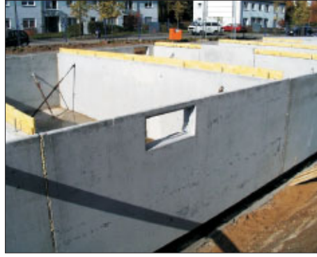
Syspro-Doppelwand und Haustrennwände im Kellergeschoß